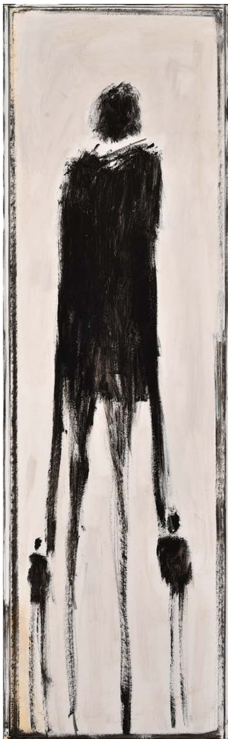
Jacky Brochu – juillet 2015